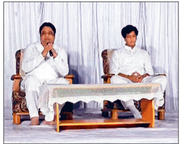
हरिभूमि न्यूज ▶▶ सिमगा

कबीर पंथियों की आस्था के सबसे बड़े केंद्र दामाखेड़ा में दीपावली की रात से खड़ा हुआ बखेड़ा खत्म होने का नाम नहीं ले रहा है। ग्रामीणों की गिरफ्तारी के बावजूद मामला शांत होता नहीं दिख रहा है। छग एवं दूसरे राज्यों से बड़ी संख्या में कबीर पंथ के अनुयाई दामाखेड़ा पहुंच रहे हैं।